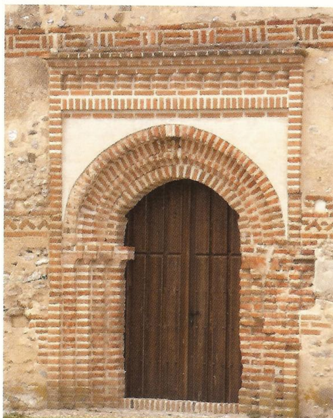
Portada de Sta. María de Melque

3. Melque de Cercos (13,5 km.) A su entrada se levanta la ermita de Nuestra Señora de la Antigua. Sus calles todavía conservan el encanto de los pueblos de la campiña y son muchos los muros y viviendas que mantienen en su construcción las pizarras y cuarcitas en alternancia, formando los aparejos tradicionales tan característicos de la