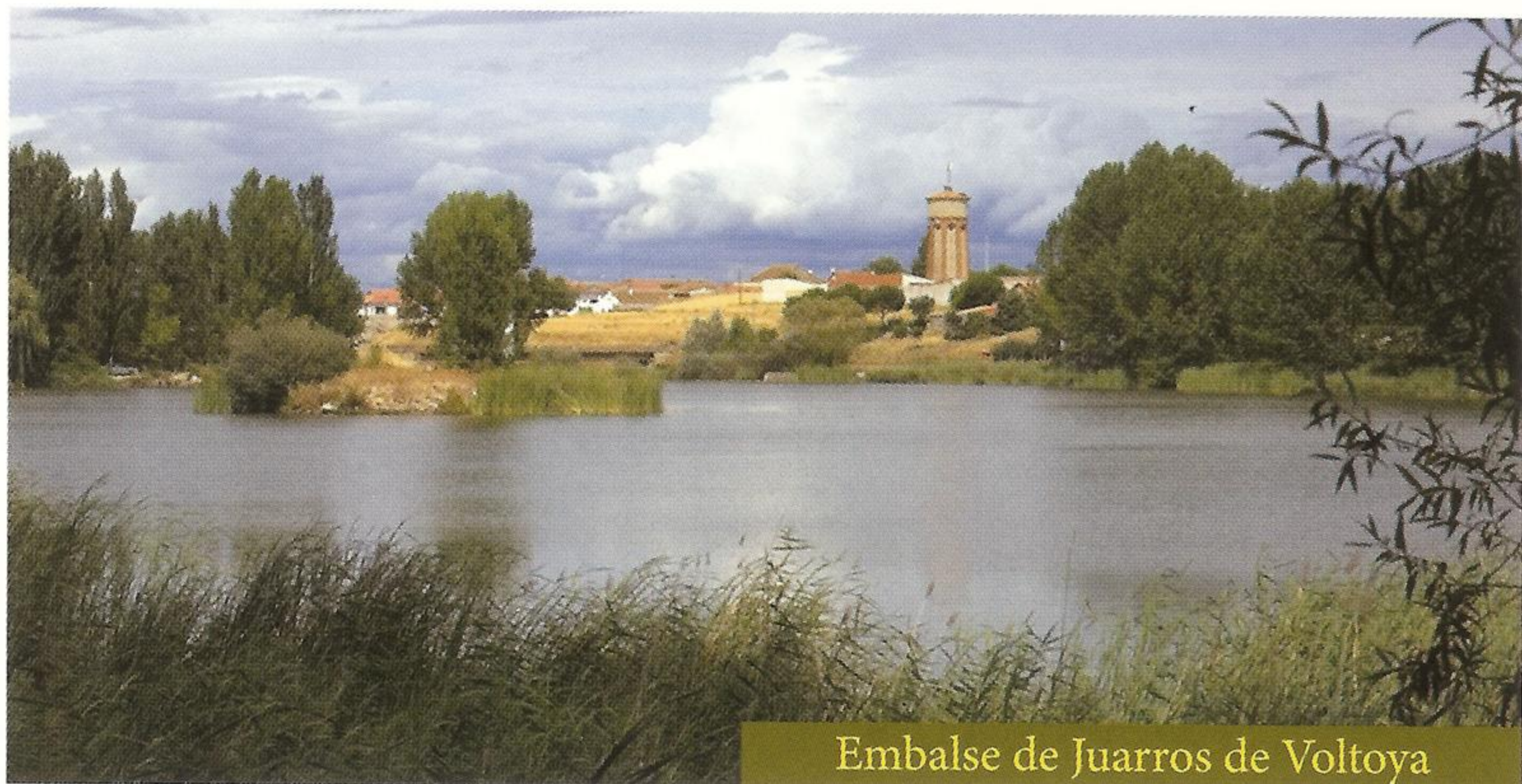
Embalse de Juarros de Voltoya

zona. La iglesia parroquial de San Esteban se levanta al lado de la carretera. En uno de los extremos de la población se encuentra la ermita de Santa María, un pequeño edificio románico de ladrillo recientemente reconstruido tras perder la techumbre. Fue declarada Monumento Histórico Artístico en 1983 y actualmente se utiliza como sala de exposiciones. Tras pasear por las calles del pueblo, nos podemos acercar a un singular paraje a las afueras del pueblo donde