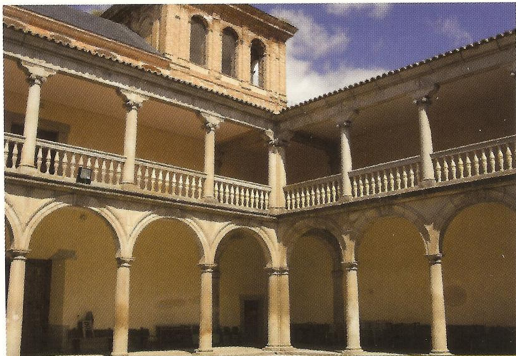
Palacio de Martín Muñoz de las Posadas

1. Martín Muñoz de las Posadas (0 km.) La gran amplitud de la plaza Mayor de Martín Muñoz de las Posadas nos da una idea de la importancia económica que tuvo el pueblo. Tanto es así que en el año 1569 Felipe II, a petición del Cardenal Espinosa, le concedió el derecho a celebrar una Feria Franca, con mercado los lunes y un día de feria anual en septiembre. Aún