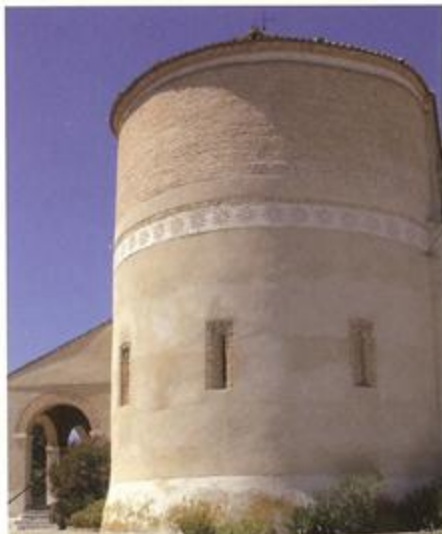
Abside de la iglesia de Santiuste

del paso de la Cañada Real Leonesa Oriental. Ya junto al río, entre las ramas de los chopos y sauces de la ribera encontramos pinzones, petirrojos, lavanderas y mirlos que amenizan con su canto el rumoroso