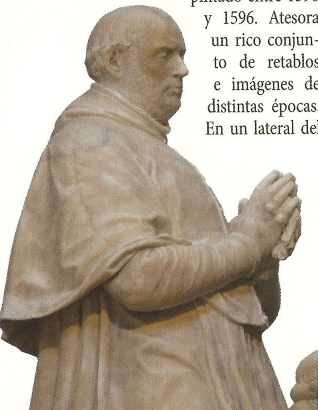
Sepulcro del Cardenal Espinosa

Salimos del pueblo en dirección a Juarros de Voltoya. Enseguida parte un camino a nuestra derecha que baja a la ermita de la Virgen de la Cabeza y al molino de la Irvienza. Junto a las ruinas del molino se conserva un puente medieval de arcos apuntados construido en ladrillo. Desde aquí podemos hacer una ruta de senderismo o en bicicleta de montaña hasta al puente de la carretera de Sanchidrián a Jemenuño, en las proximidades de Moñibas, uno de los antiguos caseríos de la abadía de Párraces. Es un recorrido suave y tendido que nos permitirá adentrarnos en el paisaje de la vega del río Voltoya.