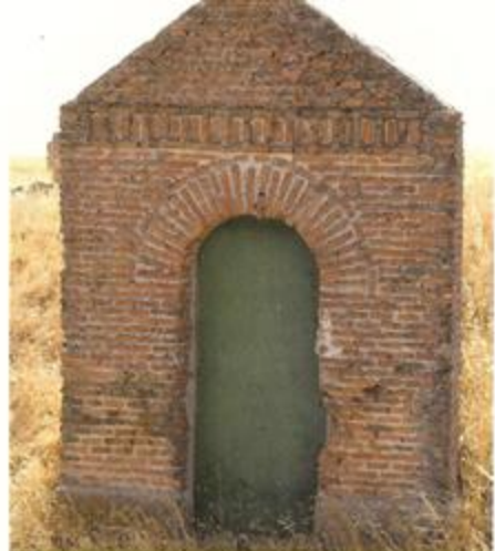
Boca de bodega en Moraleja

entre viñedos, abandonando la tierra de Arévalo para adentrarnos en la de Coca.